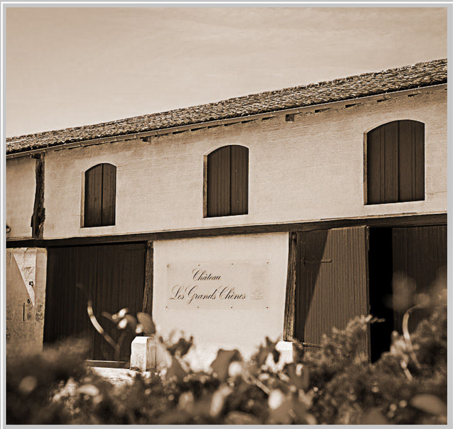
Le Château Grands Chênes