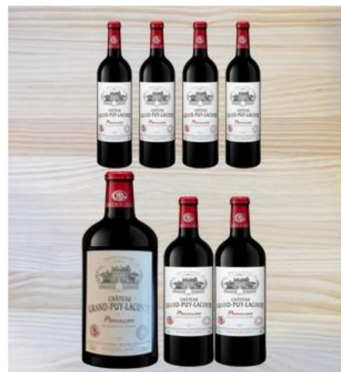
Caisse Variation (9L)