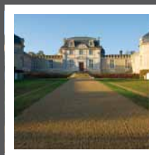
Château de Malle