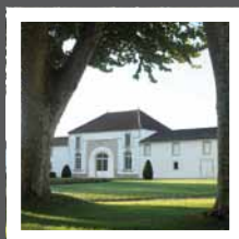
Château La Tour Blanche