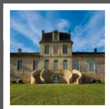
Château de Myrat